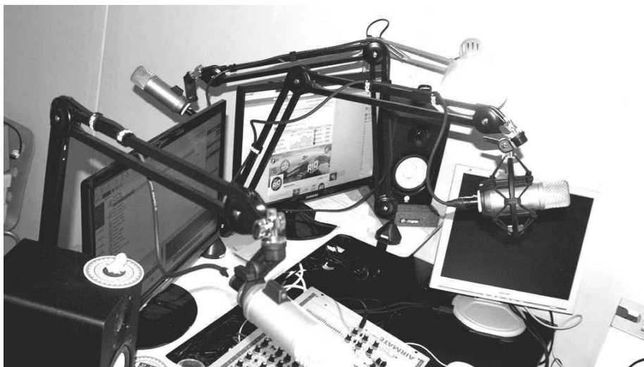
Voll digitalisiert: Blick ins Studio des katholischen Jugend-Radios "Fisherman.FM"

Zürich. – An eine religiös interessierte Jugend wendet sich das katholische Internet-Radio "Fisherman.FM". Seit Oktober ist der Sender im Netz und auch über eine App abrufbar. Er definiert sich als Radio von der Jugend für die Jugend, in welchem diese ihren Glauben kreativ umsetzen kann. Die Radiomacher sind zwischen 20 und 30. Bereits arbeiten sie grenzüberschreitend.