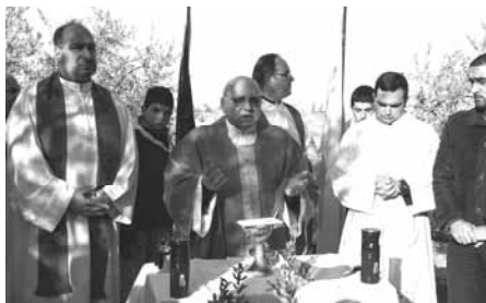
Alt-Patriarch Michel Sabbah bei einer Protestmesse gegen Israels Mauerbau

In den sechs mit Rom unierten Kirchen, die von einem Patriarchen geführt werden, sowie im lateinischen Patriarchat Jerusalem wird das Leitungsamt in der Regel durch Rücktritt frei. Ebenso gilt das in dem Dutzend katholischer Ostkirchen mit einem Bischof an der Spitze; nur in der syro-malankarischen schieden Amtsinhaber bislang durch Tod aus. Das Ostkirchenrecht schreibt fest, dass ein ehemaliger Patriarch Titel und Ehren behält, vor allem in der Liturgie; zudem hat er Anspruch darauf, dass ihm "ein würdiger Wohnsitz zugeteilt wird und Mittel aus den Gütern der Patriarchatskirche gewährt werden, durch die für seinen Unterhalt, der seinem eigenen Titel entspricht, gesorgt wird".